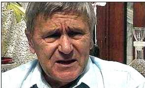
Arpad Pusztai, visiblement contrarié.