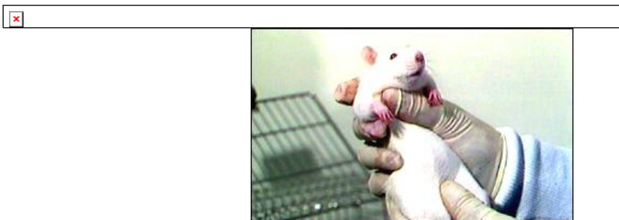
Un rat de laboratoire, avant la manip'...