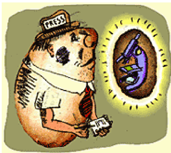
Illustration de Caleb Brown, parue dans Current Biology , 16 octobre 1998

Les tableaux pages suivantes présentent de façon synthétique le type et la provenance de l'ensemble des 154 textes constitutifs du corpus.