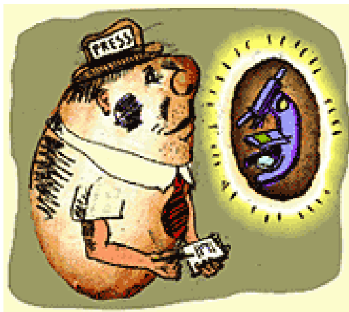
Illustration de Caleb Brown, parue dans Current Biology , 16 octobre 1998

Les tableaux pages suivantes présentent de façon synthétique le type et la provenance de l'ensemble des 154 textes constitutifs du corpus.