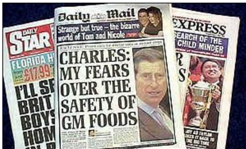
Le Prince Charles dans les tabloïds

Il précise aussi, suite aux remarques de la RS sur son « poor experimental design » que cela na rien d'étonnant : les informations étudiées par la RS, normalement destinées à un usage interne, n'entraient pas dans le détail des manips effectuées. De plus, le biochimiste écossais attaque la précipitation avec laquelle la RS a procédé, lui laissant peu de temps pour répondre – même si ses adversaires prétendent le contraire. Il aurait même reçu, “35 minutes avant” la date butoir pour sa réponse aux réviseurs, une version corrigée d'un de ces 6 avis. Alors que la première mouture était plutôt favorable à son travail – du moins pas trop critique – la seconde version aurait été réécrite dans le sens d'une plus grande sévérité, à la demande des commanditaires de cette relecture des données.