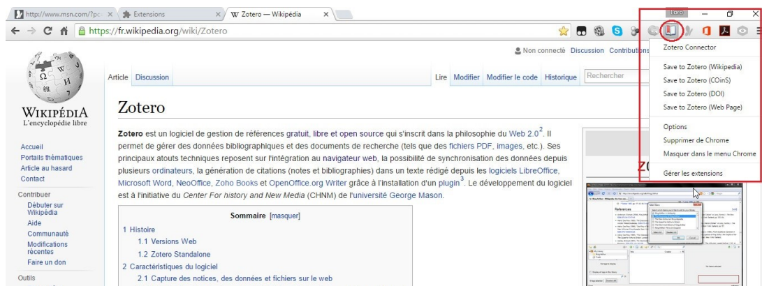
FIGURE II.1 – Intégration de Zotero aux navigateurs web (exemple de Google Chrome)

Zotero s'intègre et s'utilise facilement au navigateur web permettant la moisson des références bibliographiques et des documents office, multimédia, PDF et des pages web lors de la recherche et de la lecture sur Internet (voir figure II.1 ci-dessous). Il s'intègre aux éditeurs de textes avec l'aide d'un plug-in pour l'insertion des citations et des notes bibliographiques (voir figure II.2 ). Ce logiciel offre une gestion des fichiers de type PDF, capable d'extraire les métadonnées associées aux documents. Il assiste dans la création automatique de notices bibliographiques depuis les documents. Il gère également les citations, et les références bibliographiques.