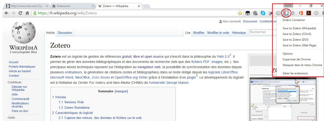
FIGURE II.1 – Intégration de Zotero aux navigateurs web (exemple de Google Chrome)

Zotero s'intègre et s'utilise facilement au navigateur web permettant la moisson des références bibliographiques et des documents office, multimédia, PDF et des pages web lors de la recherche et de la lecture sur Internet (voir figure II.1 ci-dessous). Il s'intègre aux éditeurs de textes avec l'aide d'un plug-in pour l'insertion des citations et des notes bibliographiques (voir figure II.2 ). Ce logiciel offre une gestion des fichiers de type PDF, capable d'extraire les métadonnées associées aux documents. Il assiste dans la création automatique de notices bibliographiques depuis les documents. Il gère également les citations, et les références bibliographiques.