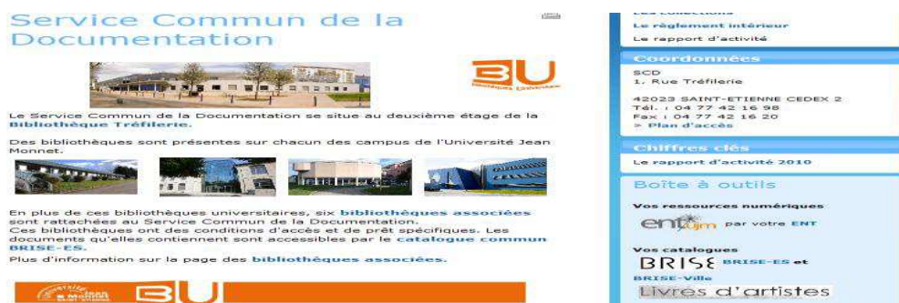
Figure 2 : le signalement du fonds de livres d'artistes sur la page du SCD de l'Université Jean Monnet de Saint Etienne

En cliquant dans la boîte à outils sur le titre « Livres d'artistes », nous accédons à la page qui présente la collection de livres d'artistes de l'Université (Figure 3) :