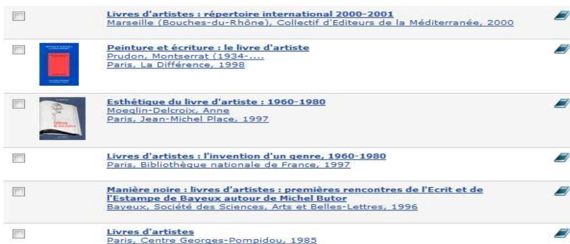
Figure 6 : la recherche avancée avec le mot sujet « livres d'artistes »

La recherche dans le catalogue avec le mot sujet « livres d'artistes » ne renvoie qu'à six documents 54 , un mélange de livres de théorie et de catalogues d'exposition (Figure 6) :