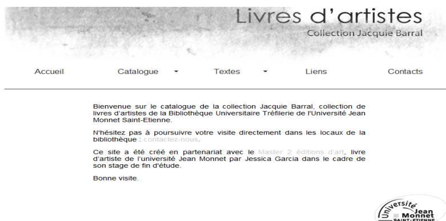
Figure 3 : la page d'accueil de la collection de livres d'artistes de l'Université Jean Monnet de Saint Etienne

En cliquant dans la boîte à outils sur le titre « Livres d'artistes », nous accédons à la page qui présente la collection de livres d'artistes de l'Université (Figure 3) :