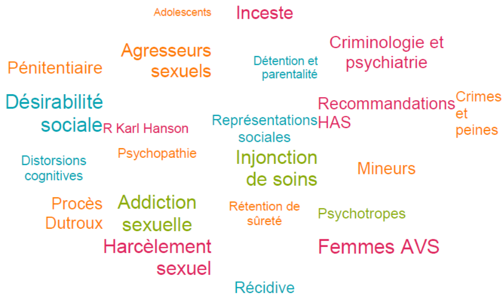
Tableau Nuage de Tags :