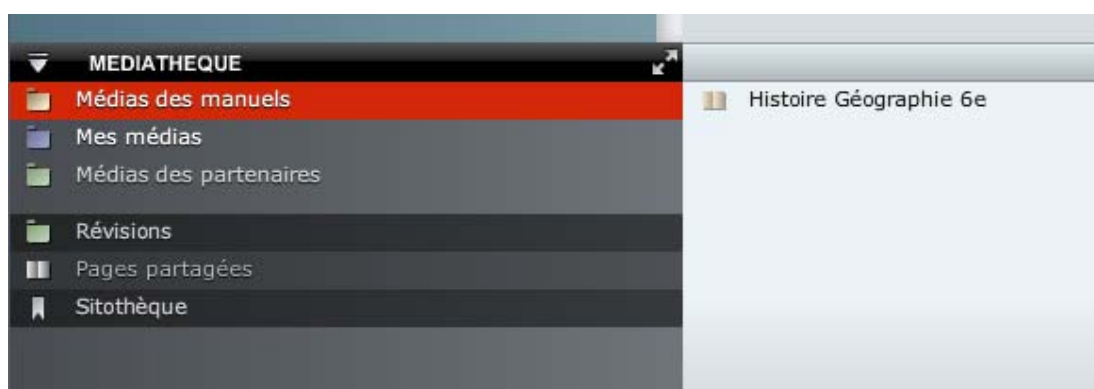
Médiathèque de la Libthèque

Le Webmaster réalise l'adaptation des contenus. Un travail de déstructuration puis de restructuration est effectué : le contenu de la maquette est importé dans l'interface de production pour être transformé. Les textes sont déchainés, les pages décomposées en unités documentaires (UD) indépendantes avant d'être incorporées à la structure du manuel numérique de manière à reproduire fidèlement sur le plan visuel le contenu de la version papier. Des liens sont créés entre les contenus des manuels et les enrichissements média (vidéos, sons, animations), regroupés au sein du répertoire Médiathèque de la Libthèque.