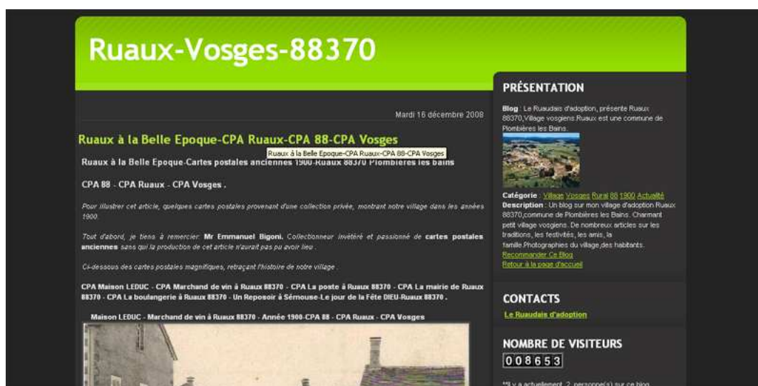
Figure 2 : Le ruauvais d'adoption < http://ruauvais.over-blog.com/ >