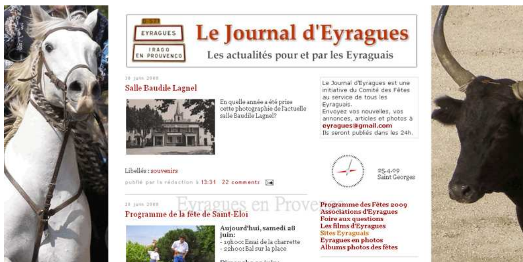
Figure 1 : Le Journal d'Eyragues < http://eyragues.blogspot.com/ >