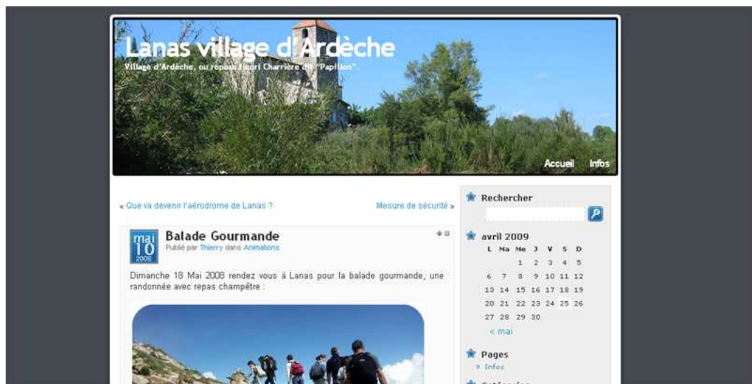
Figure 4 : Lanas village d'Ardèche < http://lanas07.free.fr/blog/ >