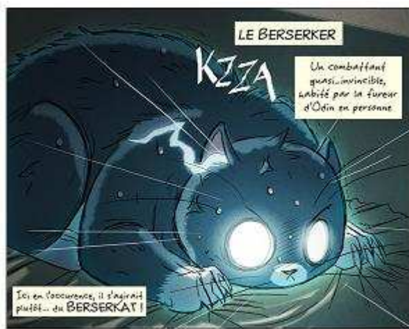
Figure 2 Vignette tirée du strip Berserkat de Maliki ©

En revanche, tout un courant de la bande-dessinée franco-belge s'inspire largement des codes graphiques et narratifs du manga pour les réadapter à la mode européenne. Et là, on assiste à quelques belles réussites, notamment chez l'éditeur Ankama. Nous pouvons ainsi mentionner le travail de Maliki 55 , qui a su digérer tous les codes graphiques du manga et de l'esthétique kawai pour créer son propre univers. Les strips qu'elle met en ligne chaque semaine sur son site 56 sont une belle preuve qu'il peut exister un universalisme de la bande-dessinée. Ainsi, on trouve sur ses petits personnages les gouttes de sueur, veines qui battent et autres traits de confusion propre au manga et qui servent à exprimer des émotions précises, tout en retrouvant par moment le souci du détail propre à la franco-belge ou aux comics.