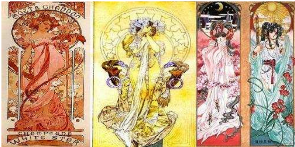
Figure 1 Illustrations de RG Veda par CLAMP © et affiches de Mucha

Mais si le légendaire asiatique a toute sa place, naturellement, dans les inspirations du manga, on peut en dire autant des mythologies occidentales. Représentatif de cette double influence, le studio CLAMP, parmi les plus prolifiques et les plus intéressants studios de mangakas, ne cesse de les faire s'entrecroiser pour créer une œuvre universelle et d'une grande originalité. Un de leurs titres phares, par exemple, X , est clairement construit sur une imbrication quasi inextricable entre l'imaginaire chrétien et les légendes asiatiques : on y retrouve aussi bien les « dragons de la Terre et du ciel » que des anges (c'est ainsi qu'apparaît la douce Kotoro, après sa mort, au héros Kamui, par exemple), sur fond d'Apocalypse. Par ailleurs, non contentes de puiser leur inspiration en Occident pour ce qui touche aux histoires racontées, elles affichent et assument l'influence qu'a l'Art nouveau sur leur esthétique. C'est ainsi qu'une œuvre comme RG Veda 29 , un autre de leurs titres phares, propose des personnages mannequins 30 dans des cadres explicitement inspirés des tableaux de Mucha.