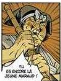
Figure 3 Vignette tirée du vol. 4 d' Okko de Hub ©

De même, certains auteurs publiés chez des éditeurs traditionnels reprennent-ils parfois quelques inspirations du manga dans une œuvre par ailleurs typiquement franco-belge dans sa construction. Nous pensons par exemple à Okko de Hub 57 dont l'image ci-dessous pourrait être directement tirée d'un manga japonais, avec ses traits qui renforcent l'exclamation du personnage