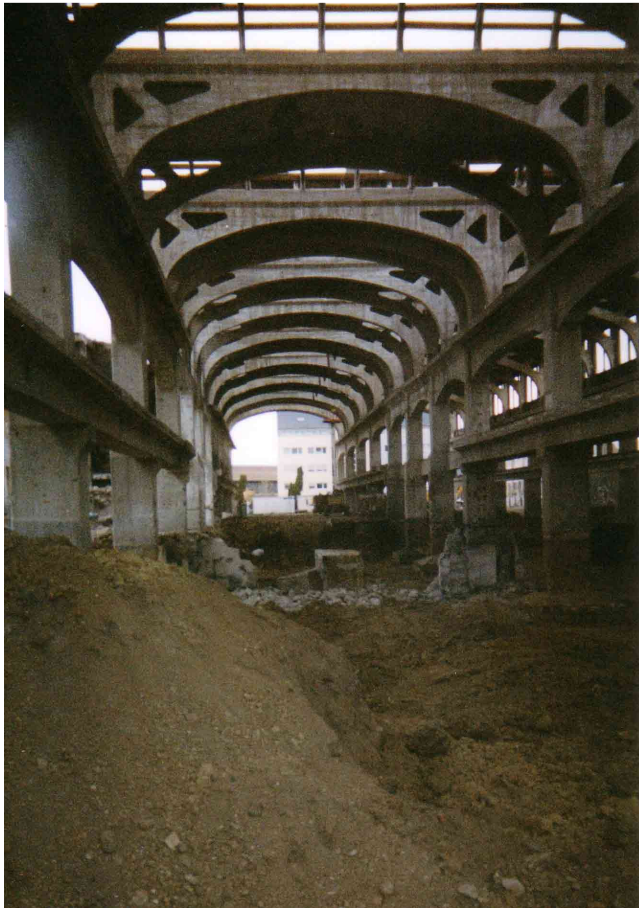
Figure 4 : la travée ouest de la Cathédrale en travaux.