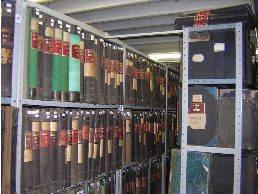
Figure 1 : une partie des registres et livres de comptes conservés dans la cave du château de Valentigney. Photo Hélène Both, 10 juin 2004.