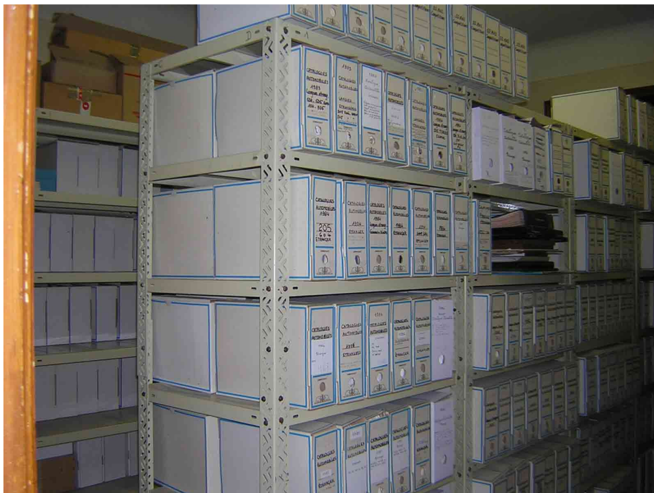
Figure 2 : stockage d'une partie des archives Peugeot au rez-de-chaussée du château.