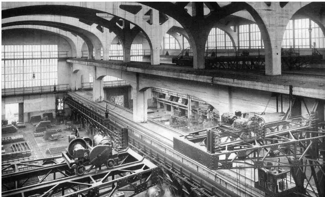
Figure 1 : la travée ouest de la Cathédrale de la SACM.

La réhabilitation de la « Cathédrale » 59 doit également accueillir un centre socio-culturel et un musée d'art contemporain ; les photographies suivantes présentent le bâtiment tel qu'il l'était à la fin du XIX ème siècle ainsi que son état actuel pendant les travaux ; les esquisses et photographie de la page 40 présentent la façade du nouveau bâtiment ainsi qu'une vue du musée.