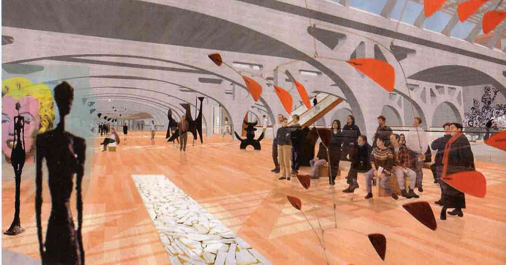
Figure 6 : vue du centre d'art contemporain. Illustration extraite de L'Echo Mulhousien , mars 2004.

Au total, les travaux aboutiront à la création d'un nouveau pôle d'activités documentaires, de recherche et de formation tout à fait inédit. Les acteurs présents sur le site pourront en effet travailler en réseau et donner ainsi accès à différents services de type culturel. Cela permettra la réunion, sur un même site, de plusieurs sources d'information jusqu'alors dispersées dans la ville.