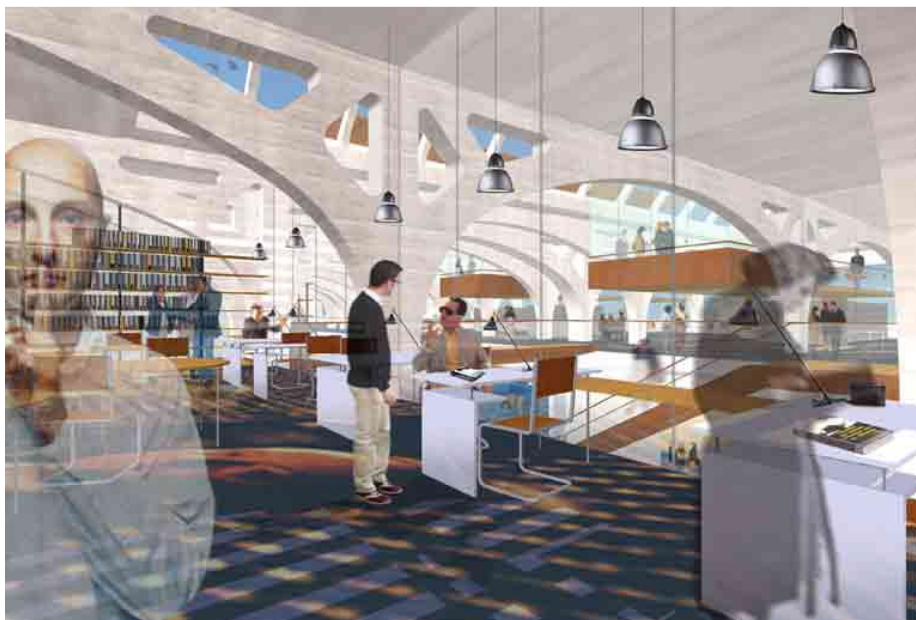
Figure 7 : vue partielle de la salle de lecture commune au CERARE et à la BUSIM.

Ces deux pôles documentaires reçoivent en effet une catégorie semblable de chercheurs, et conservent des documents 65 présentant des points communs ; leur réunion semble être une bonne solution.